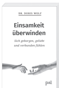
Doris Wolf Einsamkeit überwinden Auflage 70.000 Exemplare