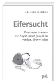
Rolf Merkle Eifersucht Auflage 150.000 Exemplare