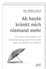
Doris Wolf Ab heute kränkt mich niemand mehr Auflage 90.000 Exemplare

Unsere Selbsthilfe-Ratgeber werden von vielen Kliniken, Ärzten, Beratungsstellen und Psychotherapeuten zur Therapiebegleitung und zur Nachsorge empfohlen. Die PAL-Ratgeberbücher sind im Buchhandel erhältlich oder in unserem PAL Onlineshop: www.shop.palverlag.de