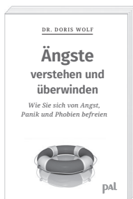
Doris Wolf Ängste verstehen und überwinden Auflage 330.000 Exemplare