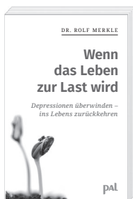
Rolf Merkle Wenn das Leben zur Last wird Auflage 130.000 Exemplare